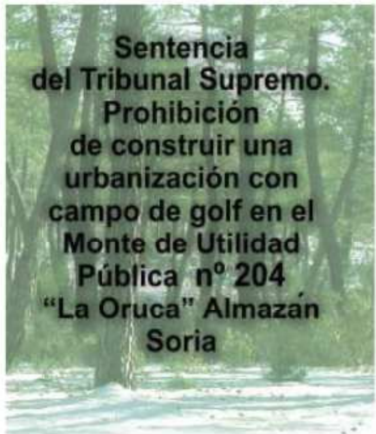
¿Almazán?, ¿Soria?, ¿Pero este tipo de chanchullos no eran exclusivos de Levante, Marbella, Mallorca, etc?.

La falta de transparencia y hábitos democráticos de nuestras instituciones las sufrimos en Soria en muchas cuestiones y afectan de forma descarada e impune al medioambiente, e indirectamente a nuestra salud y calidad de vida.