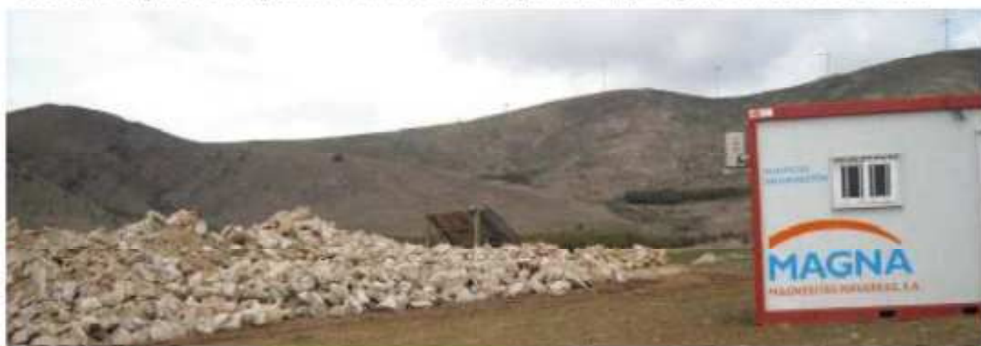
Extracción de prueba (Abril/2012). Al fondo se observa la ladera del Tablado a destruir

El 24/10/2011 la Junta de CyL, ante un recurso presentado por la asociación aragonesa Carravilla resuelve anular una autorización de ocupación temporal de terrenos necesarios para la realización de trabajo mineros de investigación, denominado "San Pablo" y solicitado en 2005, destinados a la extracción de Magnesitas. Lo cual significa que todos los trámites administrativos realizados por la Empresa Magnesitas de Borobia sean nulos, y por lo tanto no puede realizar labores de minería ni de investigación. Contradictoriamente el 19 de abril de 2012 la empresa ha iniciado una pequeña extracción alegando que tiene otro permiso de investigación denominado "San Roque", el cual aparentemente también está caducado sobre unos terrenos propiedad de 200 personas en régimen proindiviso. Es decir que requieren del permiso de esos 200 propietarios, que aparentemente no tienen.