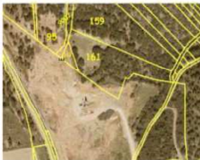
Gravera situada en el Alto del Viso (Los Rábanos) . En la actualidad las parcelas 159, 161, 162 y 163 del término de Soria capital están destruidas.

En la zona ancha a la gravera del Viso se ha realizado una tala de encinas y movimiento de tierras presuntamente sin autorización, por tal motivo se habría incurrido en una presunta infracción en materia de Urbanismo en la que es competente el Ayuntamiento de Soria. Esta zona está catalogada como Suelo NO urbanizable especialmente protegido por sus valores naturales y tales acciones denunciadas están prohibidas. El expediente sancionador está abierto en el Ayuntamiento, hemos aportado más información para la correcta tramitación de la posible sanción y hemos puesto los hechos en conocimiento de la Junta de CyL y de los Agentes Medioambientales por si ha incumplido la legislación forestal en la que es competente la administración autonómica.