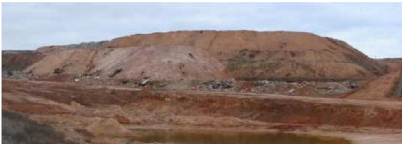
Estado del antiguo vertedero de la fabrica de baterías de San Esteban de Gormáz

Sentencia 351/2011, TSJ C y L, de fecha 9/9/2011, contra la autorización ambiental Exide Technologies, S.A., para la planta de recuperación de plomo por segunda fusión a partir de baterías y otros subproductos con contenido en plomo y el vertedero de Escorias en San Esteban de Gormaz, en la que se desestima el recurso interpuesto por la Federación.