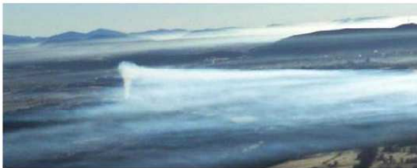
Columna de humo de tableros Losán en Soria e inversión térmica

Cuando fue puesta a información pública el proyecto de central energética a partir de biomasa en la Tardesillas desde ASDEN enviamos una carta a los ayuntamientos de la provincia de Soria con importantes masas forestales solicitándoles que alegaran a la central de la biomasa y que defendiesen ante la Junta de CyL la ubicación de este tipo de instalaciones en su municipio. Algún ayuntamiento se interesó por nuestra propuesta y han varios ayuntamientos que están estudiando el poner este tipo de centrales energéticas en su municipio .